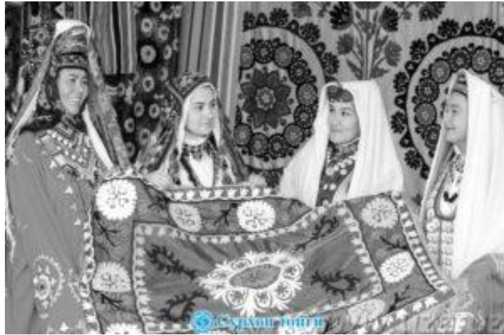
3-rasm. Ikkinchi renessans davrida milliy liboslarimiz

Qadim zamonlarda erkaklar ko‘ylagi asosan bir xil tusdagi oq matodan tikilib, kosib dastgohida to‘qilgan. Qashqadaryo, Surxondaryo va Xorazm vohalarida ham yoqasi yotiq ko‘ylaklarni kiyishgan. Chavandozlar, ovchilar esa namat-kigizdan, jun mo‘ynadan, oshlangan teridan tikiladigan cholvor kiyishgan.