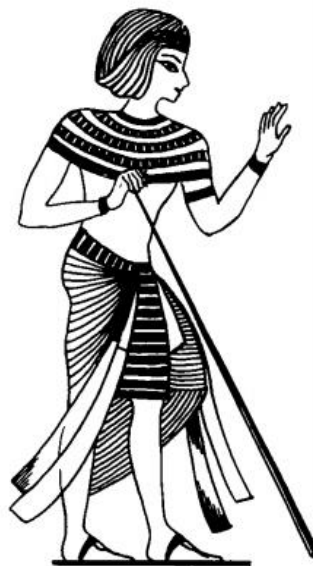
2-rasm. Fir'avnning kiyimi

kiyinar edi. Cheklash va man etishlar gazlama sifatiga va rangiga, pardoz va bezaklar miqdoriga, kiyimlar insonni qanday martaba, qay daraja hokimlik ramzi ekaniga taalluqli bo'lardi. Misr fir'avnlari va ularning yaqin zodagonlari oddiy ipdan va zig'ir toladan to'qilgan shaffof xarir gazlamadan (2-rasm). Kog'inlar esa qoplon terisidan kiyinishar edi.